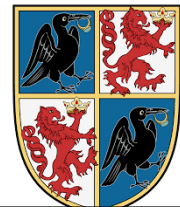
Hunyadi- 1 pont