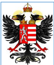
Luxemburgi- 1 pont