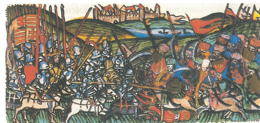
Csata a törökkel

1443-ban az előző év sikerei fellelkesítették a keresztény Európát. Támadó hadjáratot vártak Hunyaditól, s az esélyeket növelte az is, hogy II. Murád szultán belső problémákkal küszködött. Hunyadi is úgy vélekedett, hogy az ellenséget távol kell tartani az országtól, saját területén kell gyengíteni. Végül célja a török Európából történő kiűzése volt, ehhez azonban összefogás kellett. A magyar főurak igyekeztek bandériumaikat feltölteni, Hunyadi is nagy anyagi áldozatokat hozott (32 ezer aranyat adott az előkészületekhez). IV. Jenő pápa e célra megadóztatta az egyházi jövedelmeket, s bár nem sikerült szélesebb európai összefogást létrehozni, külföldi zsoldosok is csatlakoztak Hunyadihoz. Brankovics vajda támogatásával a sereg összlétszáma elérte a 35 ezer főt. Az 1443 júliusában megindult hadjárat célja Drinápoly elfoglalása volt, s ezért Hunyadi nem