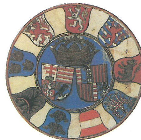
A Hunyadiak címere

Csehország nemcsak a területszerzés miatt volt fontos Mátyás számára, hanem ugródeszkát is jelentett egyben, hiszen a cseh korona választófejedelmi címmel járt a német birodalomban, sőt utat nyithatott a császári cím felé is. A beavatkozásra az adta a lehetőséget, hogy 1466-ban a Szentszék eretnekké nyilvánította Podjebrád György cseh királyt, mert engedélyezte országában a huszita áldozási módot. A cseh katolikus ellenzék kapott az alkalmon, és több uralkodónak is felajánlotta a koronát. Brandenburgi Frigyes és IV. Kázmér lengyel király visszautasították, Mátyás viszont keresztreszt hadjáratot indított volt apósa ellen. 1468-