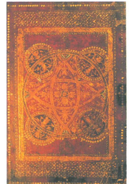
Corvina Mátyás korából

Befejezésül érdemes egy-két szót szólnunk Mátyás reneszánsz udvaráról . Uralkodása alatt szemmel láthatóan kiemelkedett a többi város közül Buda és Pest. A két testvérváros ekkortól vált igazán az ország központjává, de fejlettségét tekintve még így is messze elmaradt Európa jelentős városaitól. Az Itáliából induló humanizmus befogadása nehezen ment Magyarországon. Egyedül Vitéz János és váradi „udvara” igyekezett elterjeszteni az új eszméket, majd az 1470-es évektől Mátyás budai palotája vált központtá. Ekkor már tömegesen érkeztek Itáliából a művészek Budára, s a magyar király Európa legfőbb mecénásainak sorába lépett. A reneszánsz stílusú építkezéseket jól példázza a visegrádi nyári palota és a budai vár bizonyos részei. (Az